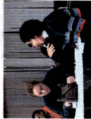
Compañeras de honorarios