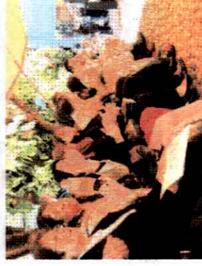
Compañeros durante la entrega de premios