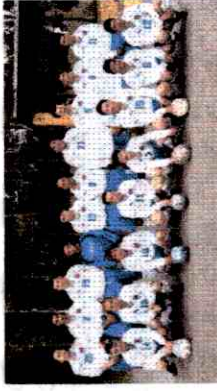
Compañeros estrenando nuevo uniforme de futbol