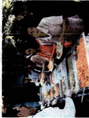
Compañeros disfrutando de los sabrosos guisados