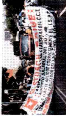
Marcha del STUACH en demanda de mejoras laborales