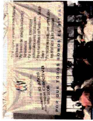
36º Congreso del SITUAM