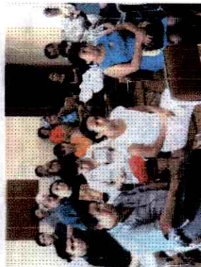
Compañeros de honorarios de varias instituciones de Educación Superior

cancelar los derechos laborales básicos de los trabajadores. Se concluyó que la regularización laboral de los trabajadores de honorarios es una de las tareas más importantes que enfrentan los sindicatos del sector.